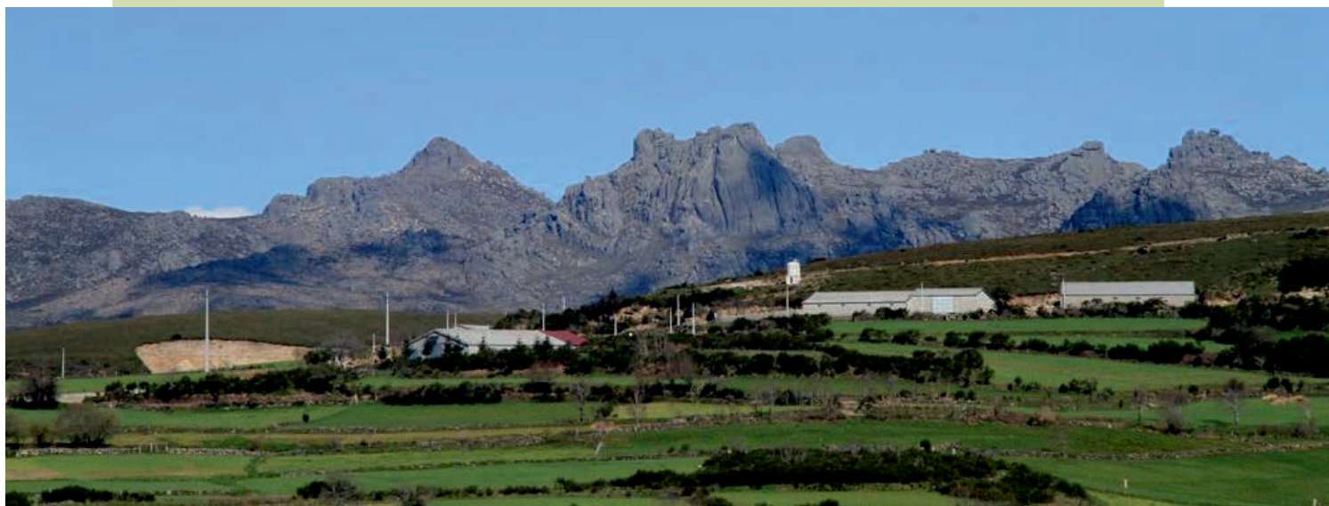
Serra do Xurés/Gerês: Coto da Fontefría, Brazalite e as Gralleiras.