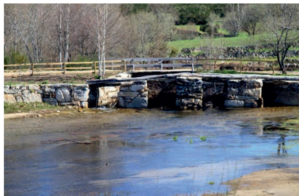
Área de lecer no río de Pitões

Para achegarse a Pitões das Júnias podemos facelo desde Calvos de Randín, por Tourém, ou desde Muíños, por Requiás e a Portela de Pitoes.