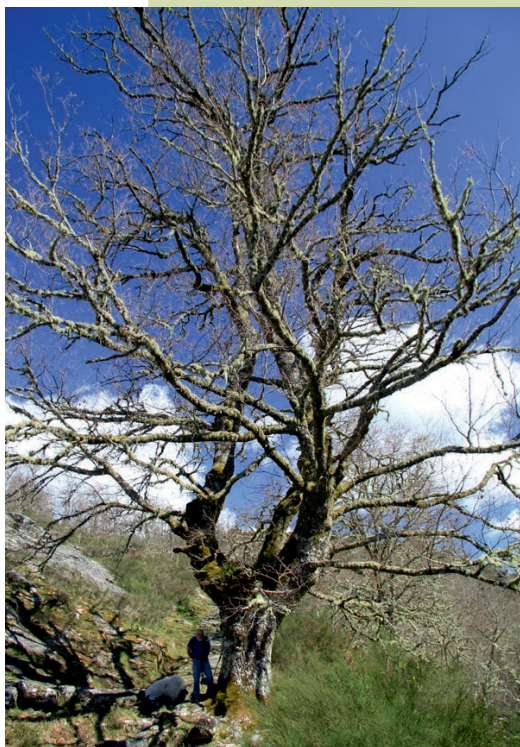
Carballo ao pé do mosteiro de Santa María das Xuñas (4 m de perímetro)