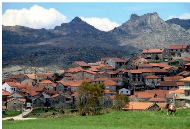
Pitões. Ao fondo o Coto da Fontefría (a segunda altura do Xurés, con 1.458 m) e diante o Brazalite.

Pitões das Júnias é unha fregresía portuguesa do concello de Montealegre. É unha das aldeas portuguesas situadas a maior altitude (1.103 m), debaixo das Gralleiras, na serra do Xurés/Gerés.